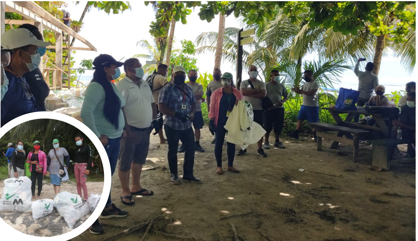
Limpieza de Playa en el Parque Marino Isla Bastimento