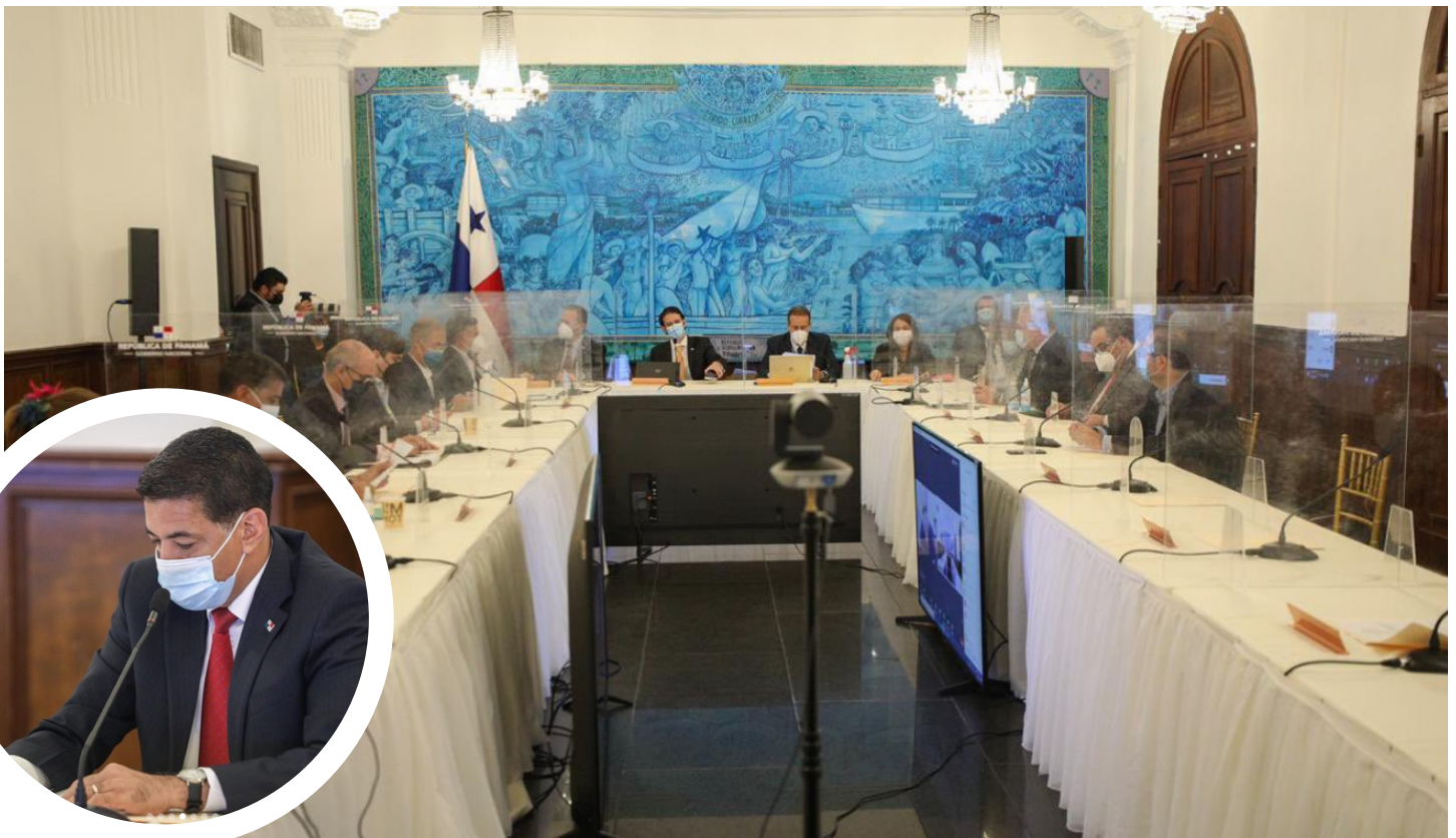
Fotos de cortesía de Presidencia de Panamá Comisión Interinstitucional para impulsar el valor patrimonial y turístico del Casco Antiguo y Centro Histórico de Panamá, con el plan de emergencia post-Covid19