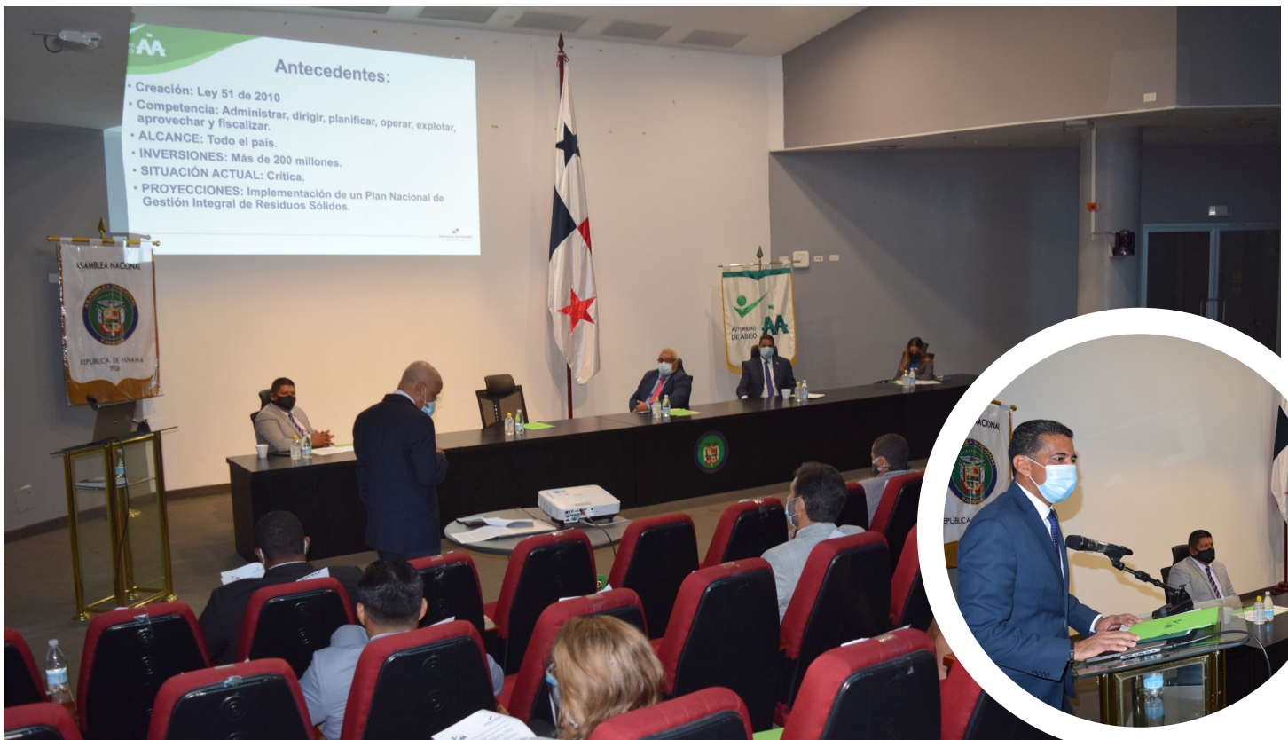
Presentación de la creación de la mesa técnica institucional ante la Asamblea Nacional.