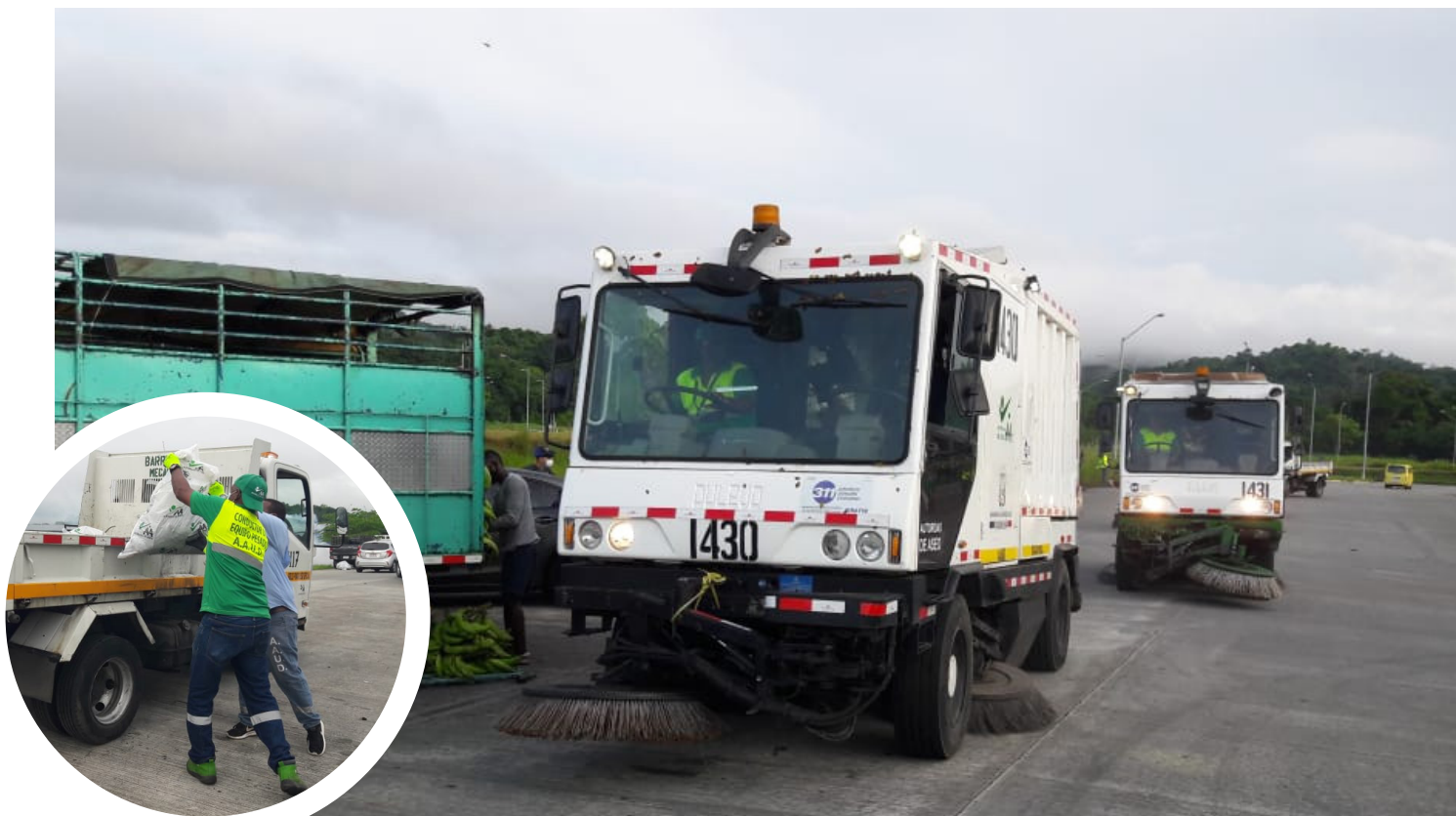
Jornada de limpieza especial en Merca Panamá