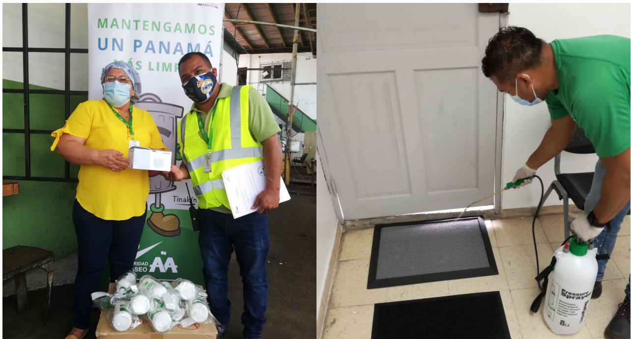
Entrega de implementos en las diferentes zonas.

Siguiendo los lineamientos y protocolos de bioseguridad, recomendados por el Ministerio de Salud y el Ministerio de Trabajo, la Autoridad de Aseo Urbano y Domiciliario, entrega nuevos insumos a los trabajadores de todas nuestras bases y continúa ejecutando cronograma de acciones a través del Comité de Salud e Higiene, en el ámbito laboral para la prevención y mitigación ante el COVID-19.