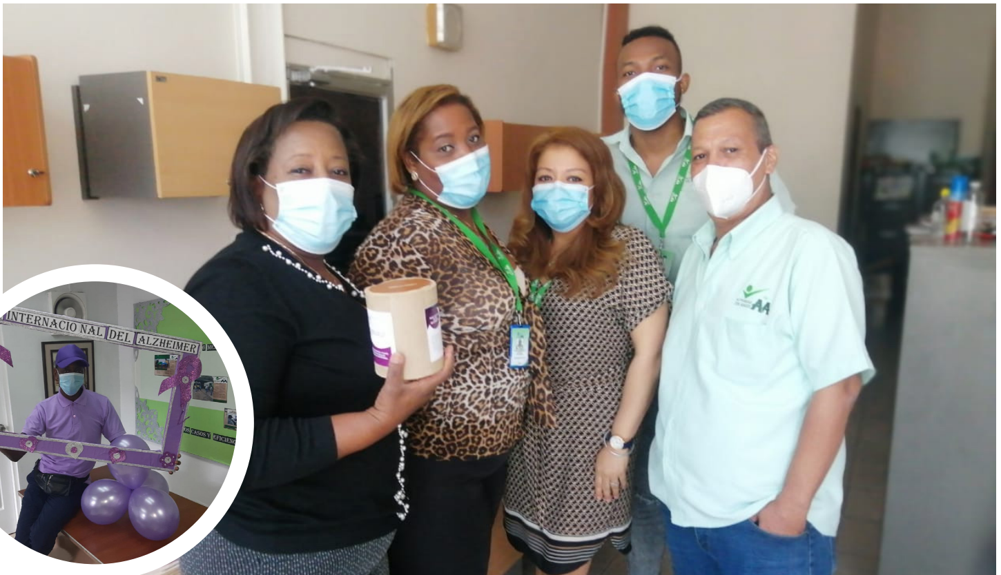
En el marco del Día Mundial del Alzheimer colaboradores realizan donación a través de alcancías en los distintos departamentos y direcciones, en apoyo a esta noble y sensible causa.