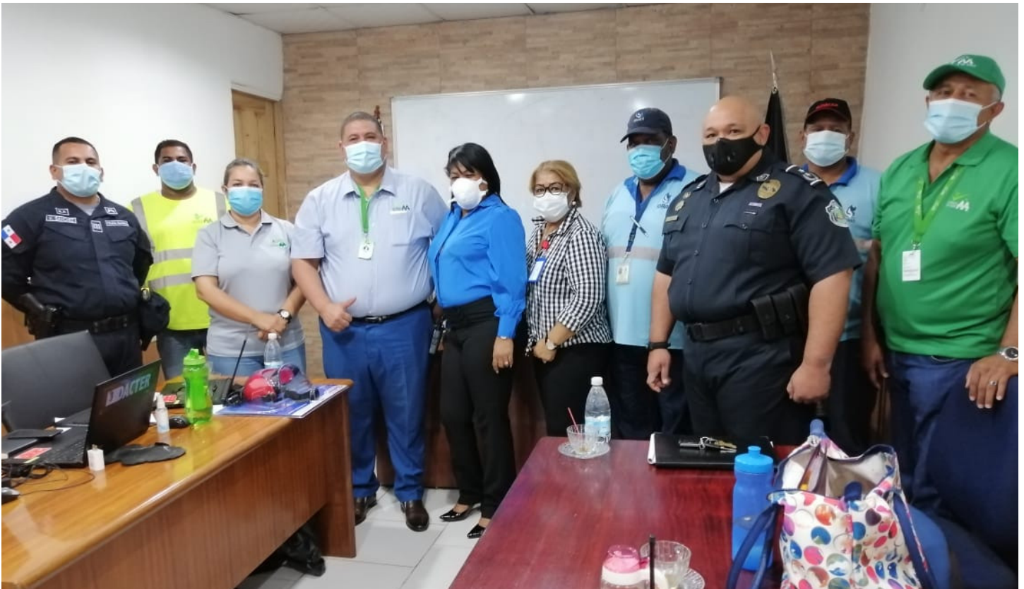
Reunión de coordinación interinstitucional, conformada por la Autoridad de Aseo Urbano y Domiciliario, representantes de Asuntos Comunitarios de los corregimientos, Policía Nacional, el Instituto de Acueductos y Alcantarillados Nacional (IDAAN) y el Ministerio de Obras Públicas (MOP).